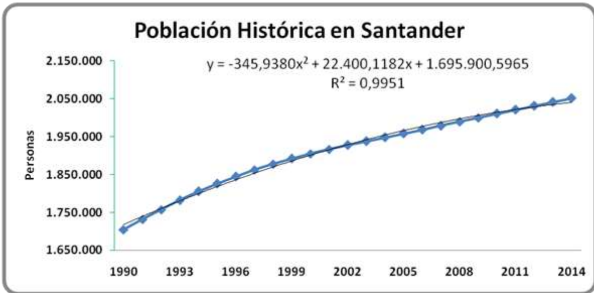
Gráfica 1. Población Histórica en Santander